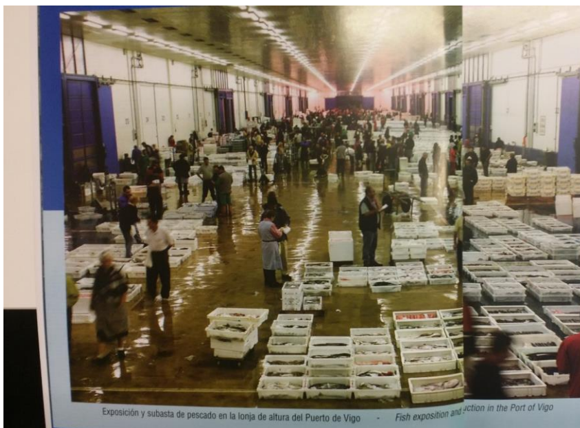
Figur 3 Fiskeauksjonshallen i Vigo havn, Galicia, Spania

Basert på at store mengder fersk fisk går gjennom dette systemet daglig, og at mye av fisken blir konsumert lokalt på restauranter, tyder det på at denne praksis ikke medfører nevneverdig risiko for matforgiftning fra patogene bakterier. Dersom dette hadde vært tilfelle, ville en relativt enkelt kunne følge produktet tilbake i den korte distribusjonskjeden for å identifisere hvor kontaminasjonen hadde skjedd. og Deretter ville en kunne endret rutiner for å redusere risikoen for smitte av sykdomsfremkallende bakterier ved for eksempel vask, beskyttelse av kasser under stabling, ikke sette kassene direkte på gulvet osv.